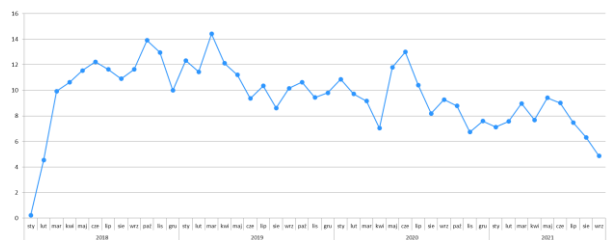
Rysunek 1. Nowe terminale w Programie Polska Bezgotówkowa w danym miesiącu

możemy zauważyć ślad drugiej fali pandemii oraz odbicie, już nie tak silne, ale zauważalne latem 2021.